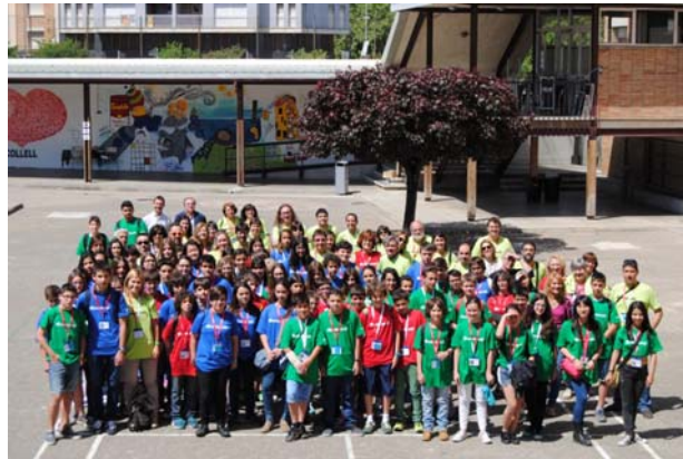
1: Participants fase final FEM Matemàtiques 2015

Els 3 alumnes guanyadors de 2n d'ESO de la fase final catalana són els representants de Catalunya a la Olimpíada Matemàtica Espanyola organitzada per la FESPM (Federación Española de Sociedades de Profesores de Matemáticas): http://www.fespm.es/-Olimpiada-Matematica-